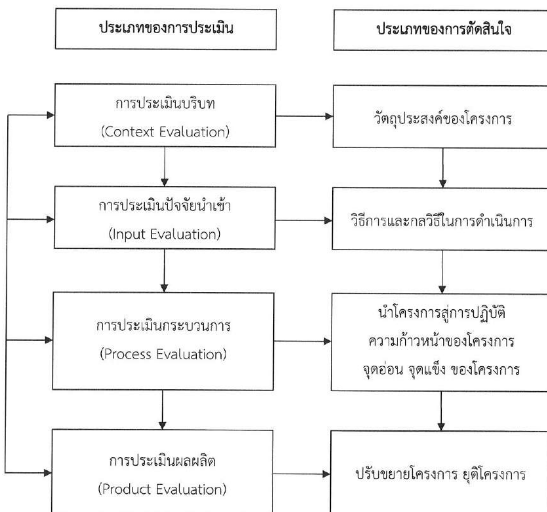
ภาพที่ 1 รูปแบบการประเมินที่ช่วยในการตัดสินใจของ Stufflebeam

ประเมินจะให้สารสนเทศเพื่อการตัดสินใจเกี่ยวกับอนาคตของโครงการว่าควรคงไว้หรือควรปรับ ควรขยายโครงการหรือควรหยุดโครงการตามเวลาที่กำหนดไว้หรือควรยกฐานะเป็นโครงการประจำ ดังภาพที่ 1